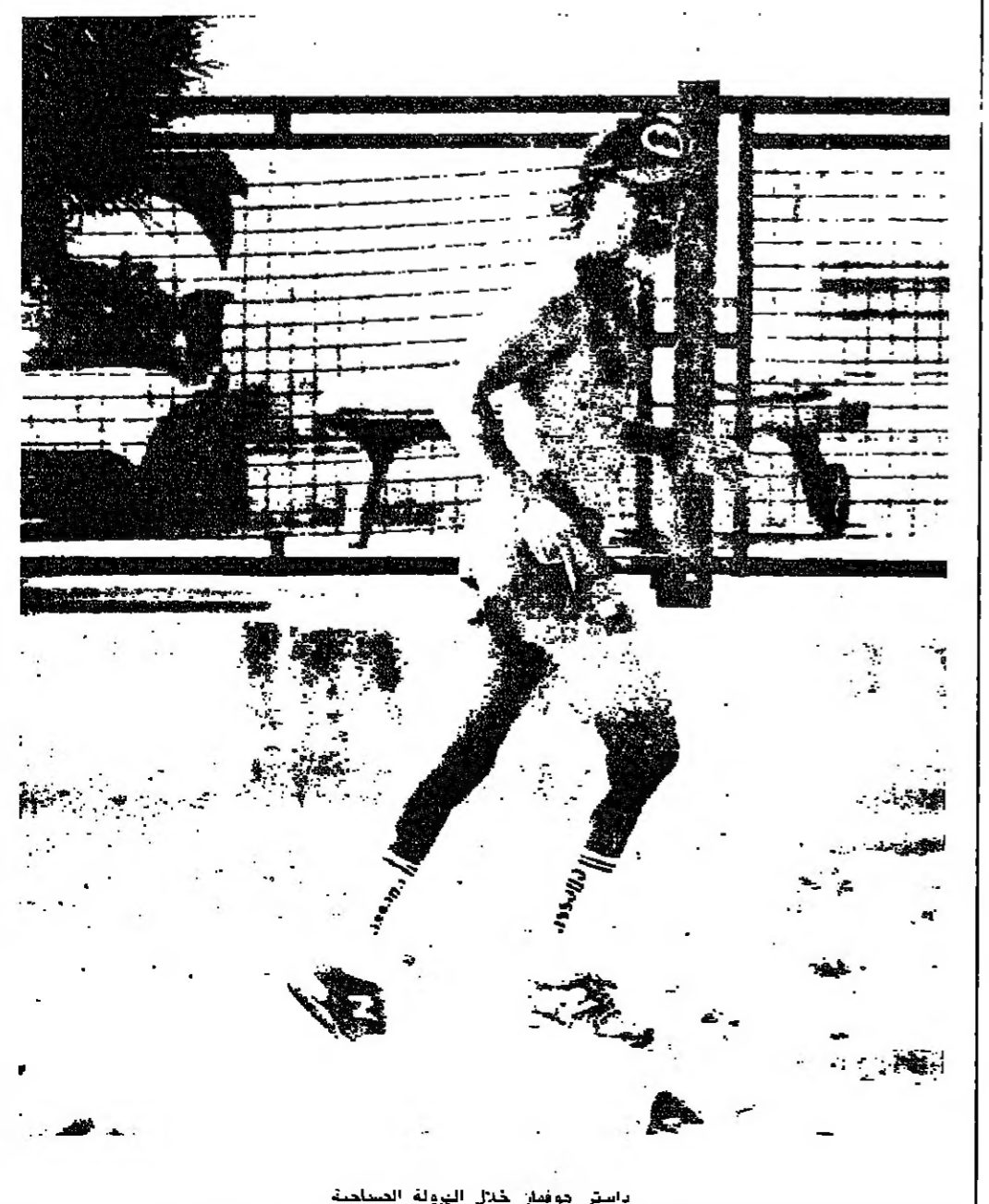
داستن هوفمان خلال الهرولة الصحافية